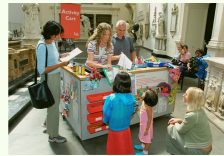
④アートプロジェクト