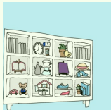
①コレクションボックス